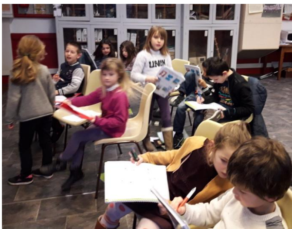
Photo 1: les enfants découvrent un instrument (et l'essaient), la guitare. Photo 2, ils remplissent les 1ères pages de leur carnet de l'élève.